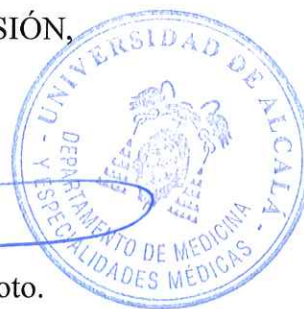
Melchor Álvarez de Mon Soto.