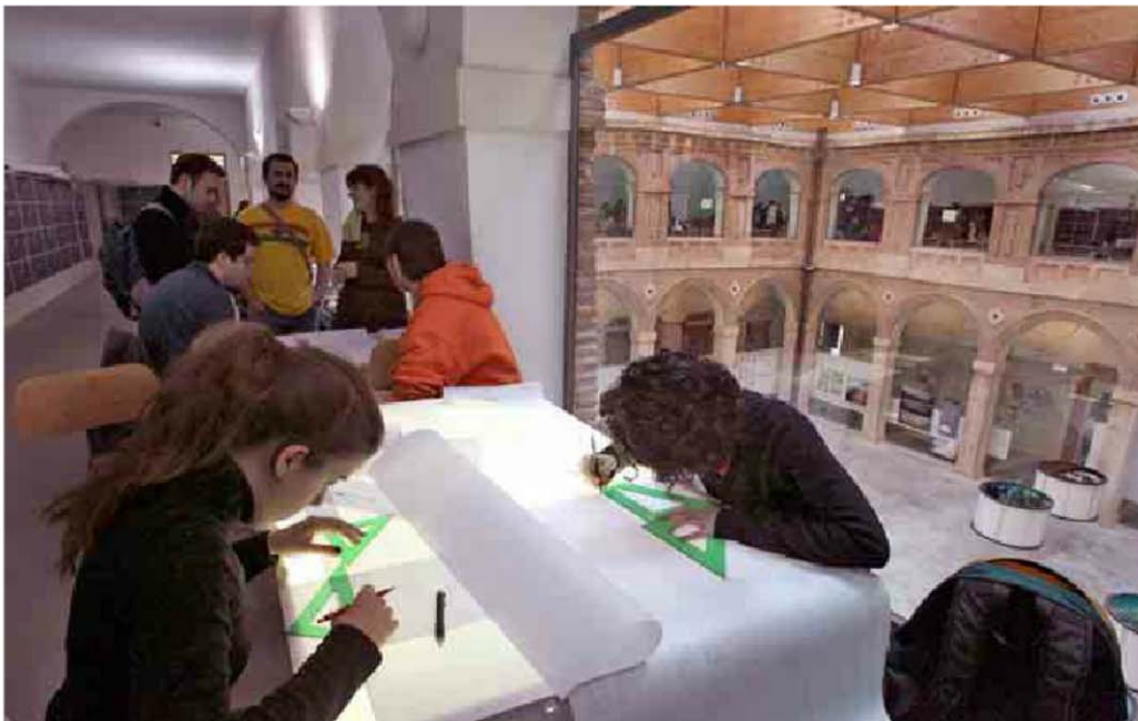
Varios estudiantes trabajan sobre unos planos en la Escuela de Arquitectura de Alcalá. / JOSÉ AYMÁ