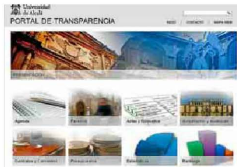
Página principal del portal de transparencia de la UAH.

Los presupuestos, los convenios y contratos, las actas de los órganos colegiados, las encuestas de satisfacción de los estudiantes... todo a pocos clics de distancia para cualquier ciudadano.