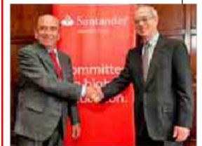
Imagen del acuerdo con el MIT.

Todo comenzó cuando el MIT International Science and Technology Initiative (MISTI) incluyó a Brasil en su programa de talleres entre investigadores del MIT y grupos procedentes de cerca de 12 países. Además, se lanzó el MIT Brazil con el objetivo de fomentar la investigación universitaria e identificar oportunidades que facilitarían a los estudiantes su estancia en el gigante latinoamericano.