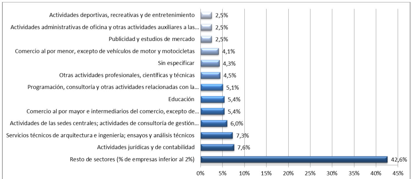
Gráfico 1. Entidades / empresas colaboradoras por sectores de actividad económica (%)

*Según la Clasificación nacional de Actividades Económicas (CNAE) a dos dígitos